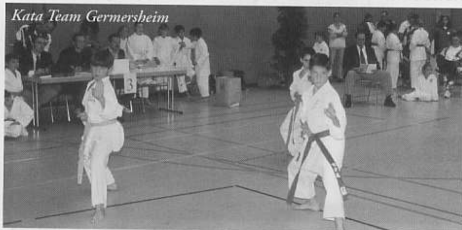
Kata Team Germersheim

RKV-Meisterschaften der Kinder und Schüler in Frankenthal