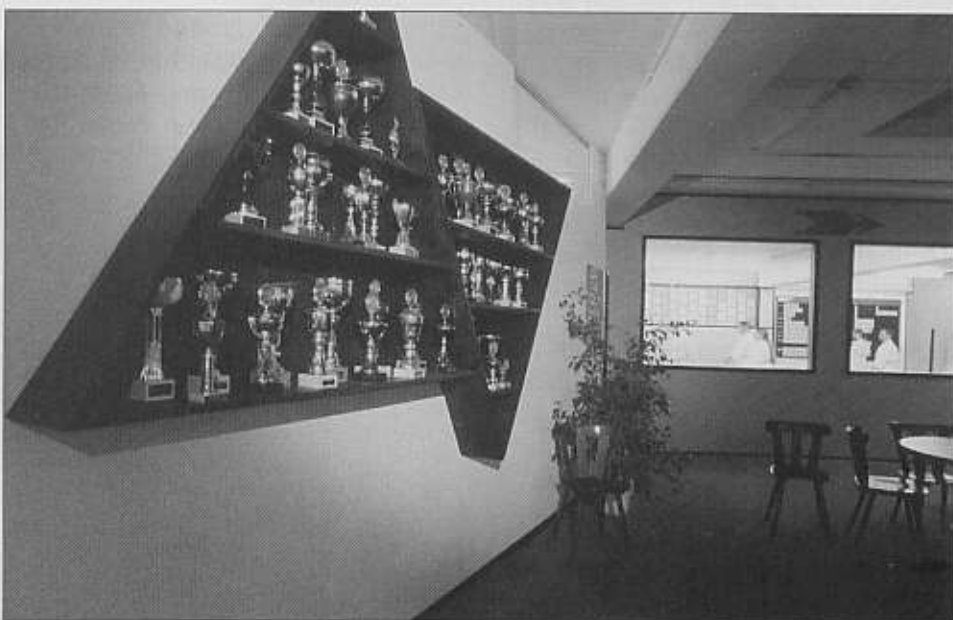
Pokalwand: Rückblicke auf die vielen Erfolge des SKC Frankenthal

Als ich ankomme macht das Schild an der Einfahrt mit ca. 2m x 2m klar, das hier der 1. SKC Frankenthal e.V.