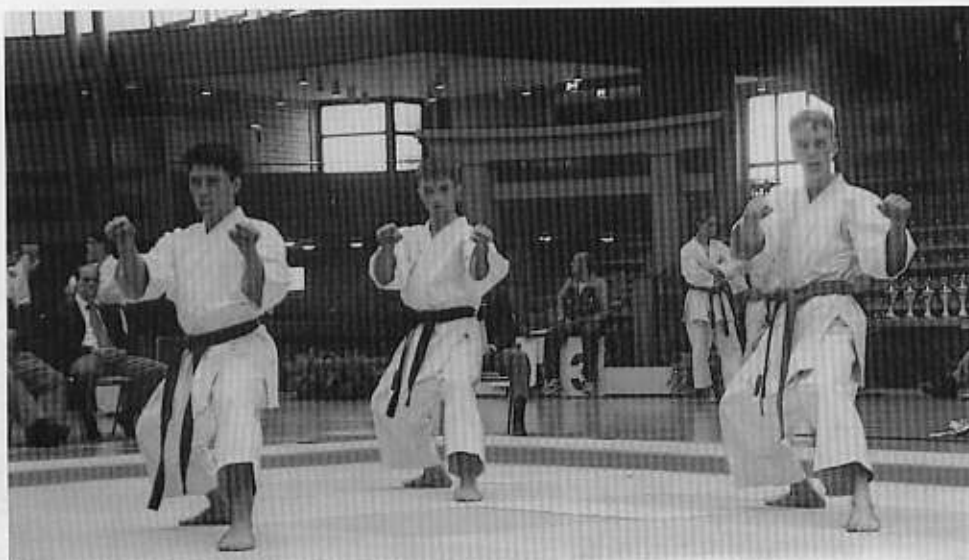
1. KV Ludwigshafen